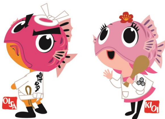
博多祇園山笠公式キャラクター

「博多 祝めで鯛」…福岡県を代表する祭り「博多祇園山笠」の初の公式キャラクター。より多くの皆さんに山笠に親しんでもらえるよう、また福岡の街や人々を元気にする存在になれるよう、櫛田神社で御祈願を受けた「縁起の良い」存在。グッズを身に付ければきっと幸せがやってくる?!